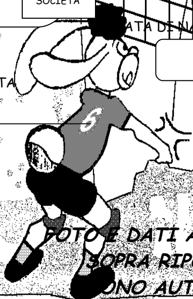
FOTO E DATI ANAGRAFICI SOPRA RIPORTATI SONO AUTENTICI